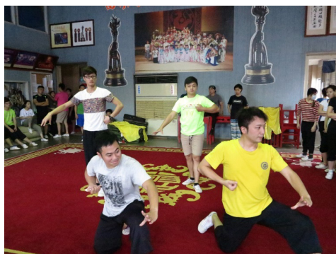
圖 8 客家戲曲學苑的排練照