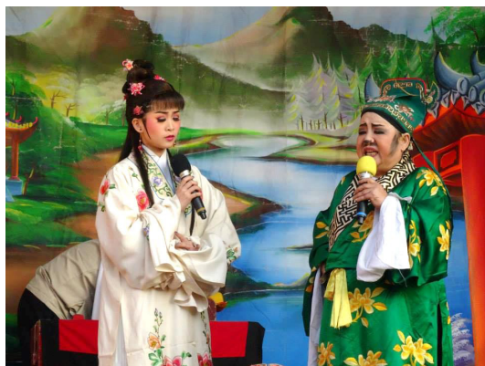
圖 6 演出廟會平安戲

此計畫的教學重點主要有：全劇種的大戲教習。課程以「三年」為一梯次規劃，傳授兩到三部新編改良大戲，培訓藝生表演大戲的能力。並定期在期中、期末於大型室內劇場或文藝中心發表演出。我們也相當注重「隨團見習」，不論是大型公演、全臺巡演，甚至是廟會的平安戲，均會帶領藝生一同參與劇團的活動。目的是讓藝生能夠隨著劇團深入民間，體認傳統戲曲的人文環境。培訓課程內容則採行表演人才與文武場人才訓練並重的方向，培訓有能力及興趣學習編劇、導演的年輕團員學習編導能力。藉以維持提升演員與音樂的水準，防止發展失衡的情況，使培訓計畫能達到永續傳演的目標。