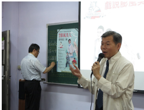
圖 18 「戲說彭風美人」校園推廣活動

說明：2017 年五月十日於國立清華大學（南大校區）舉辦「戲說彭風美人」推廣講座。