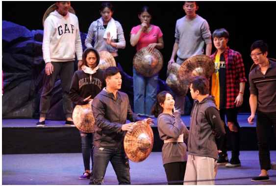
圖 7 2017 客家大戲《駝背漢與花姑娘》的排練情形

生的演練充實有據，在基本教練之後，我們再接以小戲，終而大戲的進階訓練方式，讓藝生有較完整的學習歷程。總體來說，是採行以「基本功、小戲、大戲」三階段的教習方法。除了固定排演之外，我們還安排學生隨團見習，以實際的演練讓學生直接深入客家戲曲的人文環境。這項安排主要是參酌早期的客家戲班在訓練藝生時，都是隨團學習客家戲的情況，這些隨團學習的藝生一方面可以學習客家戲，一方面又能充分了解客家戲從業人員實際的工作情況與文化。