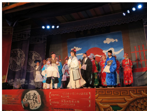
圖 12 2017 桃園客家文化節平安大戲巡演《鹽甕記》

說明：2017 年十月二十日晚上六點於桃園市桃園區大樹林天后宮（陽明公園）演出傳統精緻客家大戲《鹽甕記》。