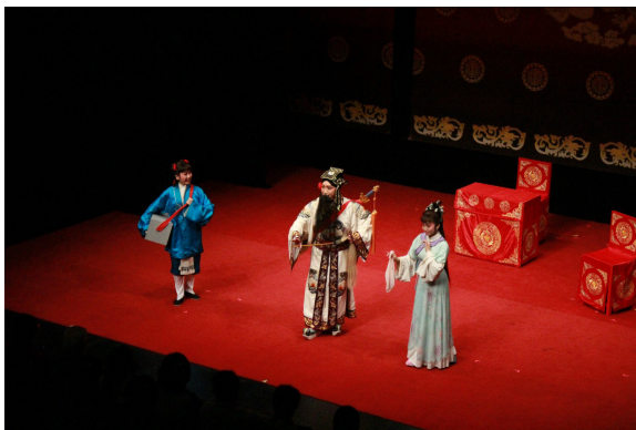
圖 13 臺灣戲曲中心 106 年《新秀舞臺－戲曲青年菁英匯演》

說明：於 2017 年十一月十日與十二日參與「承·功－戲曲新秀舞臺」活動，演出客家小戲《牡丹對藥》，由劉姿吟、陳怡如、方朋瑜領銜主演，他們皆為本團重要表演新秀。