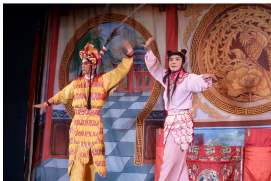
圖 14 外臺民戲演出