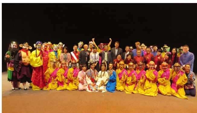
圖 10 2017 洛杉磯客家大戲公演活動

說明：美洲臺灣客家聯合會於 2017 年八月六日晚上七點在洛杉磯帕薩迪納市政禮堂 Pasadena Civic Auditorium 表演廳舉行 2017 年「臺美慈善音樂會 - 遺愛抗癌」慈善活動，特邀榮興客家採茶劇團公演《真假美猴王》。