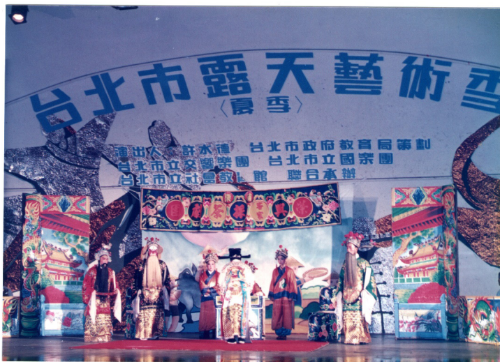
圖 2 榮興客家採茶劇團的首次公演。

說明：1987 年 9 月，榮興客家採茶劇團參加在臺北新公園（二二八公園）舉行的「臺北市夏季露天藝術季」，演出《王淮義買阿爸》。