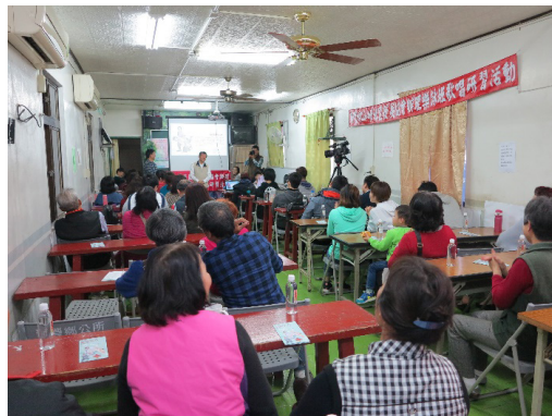
圖 16 2017 客家傳統戲曲藝術深耕推廣活動

說明：講座包含客家傳統戲曲概說、身段唱腔示範及服裝道具扮相介紹等客家傳統戲曲相關內容。