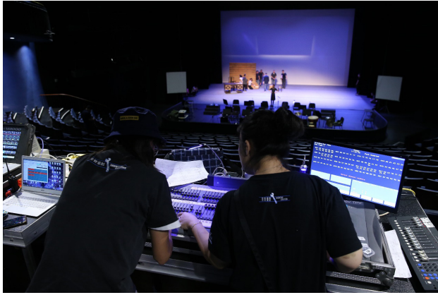
圖 4 榮興客家採茶劇團的「技術組」工作人員