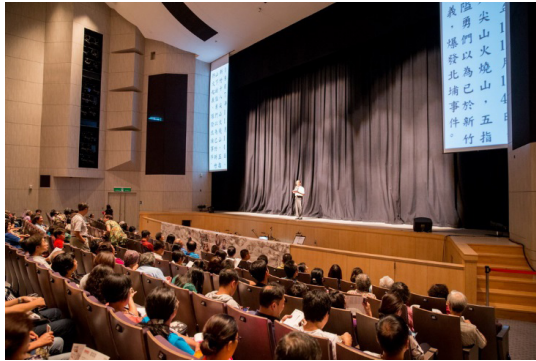
圖 17 2016 精緻客家大戲《日落大隘》演出前的導聆

說明：2016 年九月三日的苗栗巡演場特別安排學者在演出前講述本戲背景：「北埔事件」的歷史。