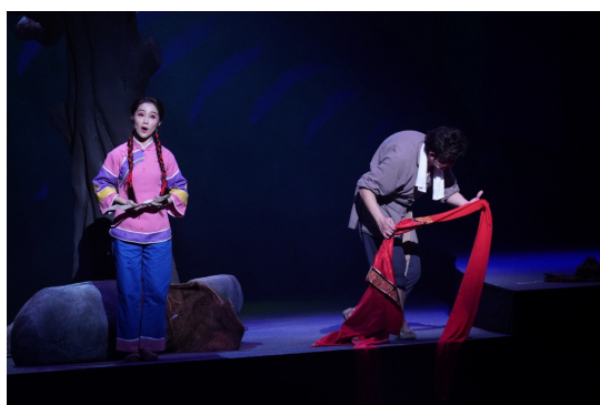
圖 9 2017 客家大戲《駝背漢與花姑娘》演出照

團培訓的新秀演員來說，不同的表演場域能夠誘發他們，增加他們的演出經驗與應變能力，是一個很好的機會教育。