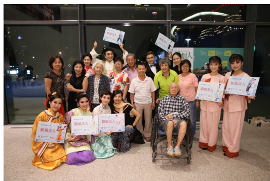
圖 11 2017 精緻客家大戲《膨風美人》演員與民眾互動合影

說明：客委會辦理「精緻客家大戲展演」活動，推廣傳統客家戲曲藝術文化，讓客家鄉親能在優質的展演空間觀賞客家大戲，以呈現更精緻且完美的演出。