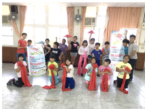
圖 15 2017 客戲一夏戲曲研習營

說明：針對學生進行傳統客家戲的技藝傳習，讓學生親自體驗客家戲曲表演，以培養學生對客家戲曲的興趣。