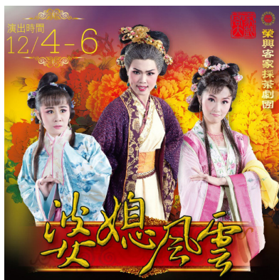
圖 5 2015 客家大戲《婆媳風雲》廣告

《婆媳風雲》在國家戲劇院的公演結束後，個人開始著手進行申請「演藝團隊發展扶植計畫」，但是沒有錄取，後來經由各方人士的建言，文建會（現「文化部」）提出補救措施以專案方式來協助榮興客家採茶劇團的發展，於是個人制定了「客家戲曲表演人才培育計畫」，希望能栽培有志於客家戲曲的年輕子弟兵。